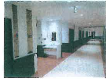
ストレスケアユニット