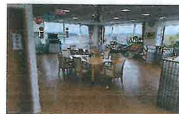
デイケア和～なごみ～