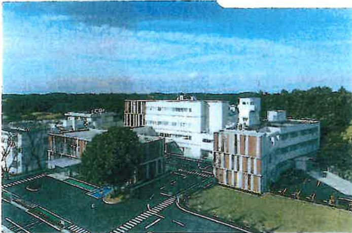
埼玉森林病院全景 令和 2 (2020) 年 10 月増改築工事完了。